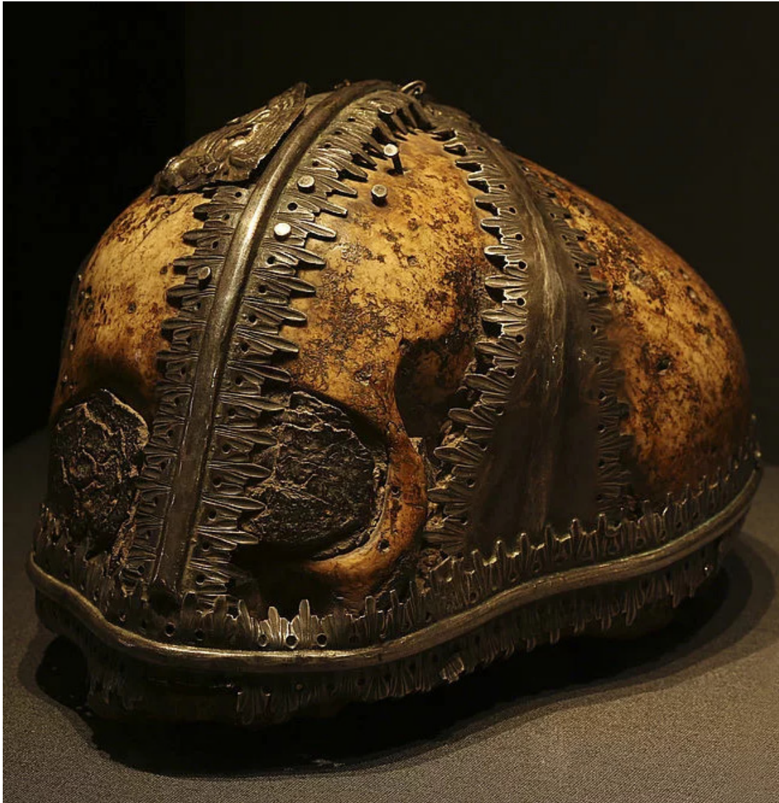
Abb. 4: Silberfassung mit Schädel des heiligen Jakobus minor, © Kulturstiftung Sachsen-Anhalt, Fotograf: Christoph Jann, https://www.dom-schatz-halberstadt.de/fileadmin/_processed_/7/d/csm_Domschatz_Jacobusschaedel_Christoph_Jann_0b0fecefe0.jpg