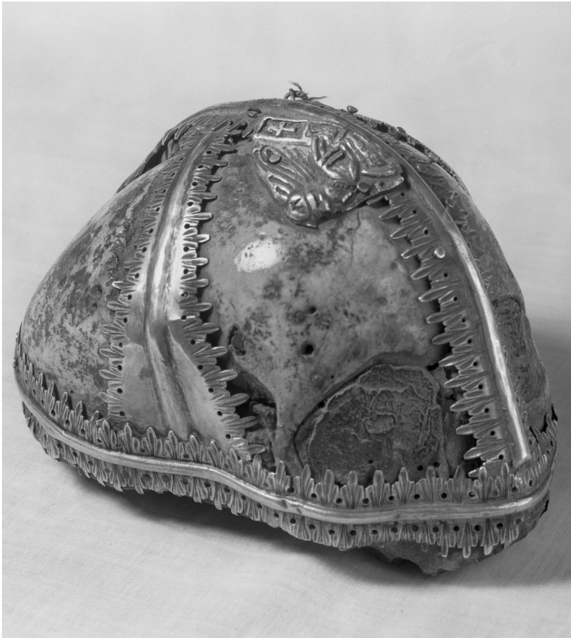
Titelbild; Abb. 2: Silberfassung mit Schädel des heiligen Jakobus minor , 1201/1215, Schädel, Silber, Dom und Domschatz Halberstadt, Bilddatei-Nr. fm87661, Bildarchiv Foto Marburg, Foto: Holzer-Lexis, 1936, https://www.bildindex.de/document/obj20635061?medium=fm87661 .