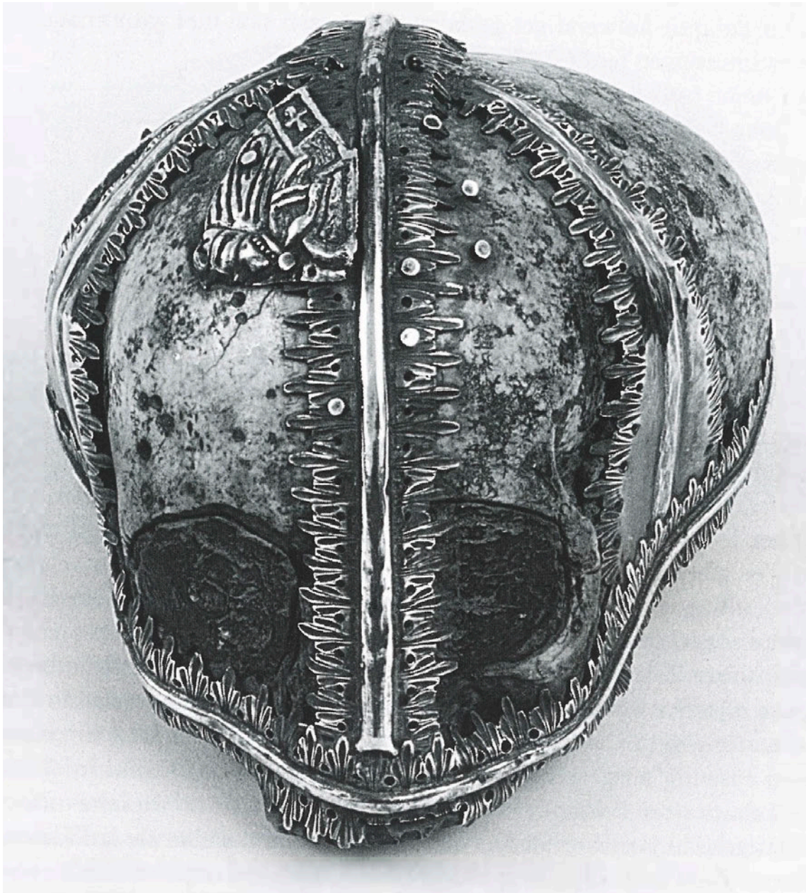
Abb. 3: Silberfassung mit Schädel des heiligen Jakobus minor, Janke, Ein heilbringender Schatz, Abb. 57, 221.